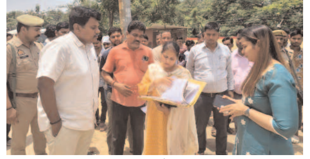
निरीक्षण करते डीएम।